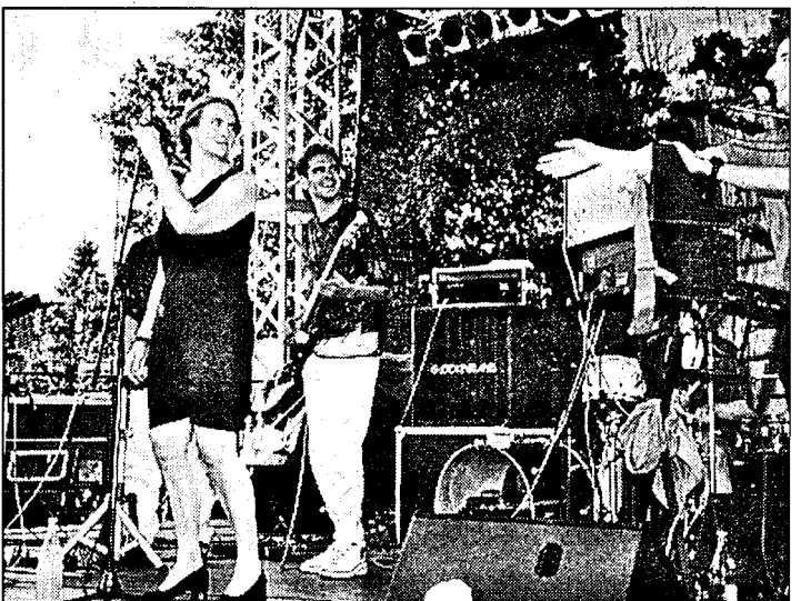
Mit Live-Musik und elektronischem Computersound sorgten die Bands

Insgesamt kann man sagen, dass das „Syndromeda“-Konzert als bisher nicht nur im Kreis einmalige Veranstaltung hoffentlich im nächsten Jahr wiederholt wird. Denn - auch, wenn die Musik nicht jedermanns Geschmack sein wird - das gesamte Erlebnis war wirklich beeindruckend.